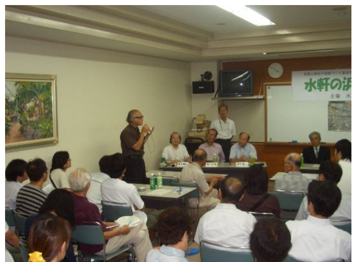
会場からのコメント