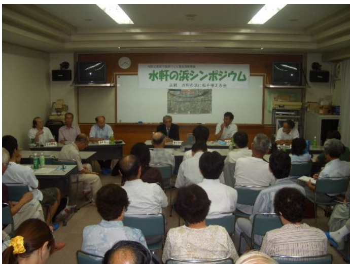
パネルディスカッション