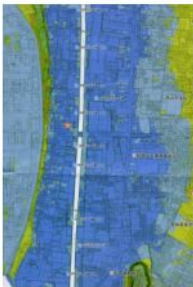
水軒地区の概要マップ