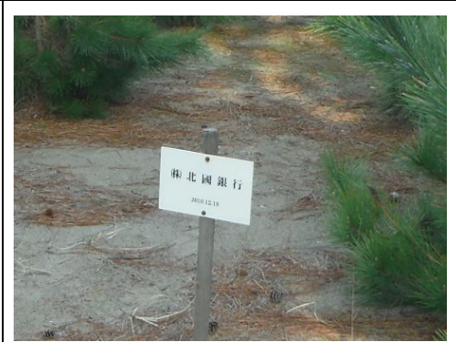
北国銀行の名札 2010 年 12 月