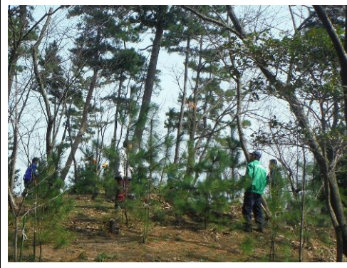
山で活動するボランティア