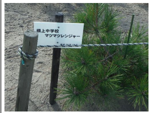
根上中学校マツマツレンジャー