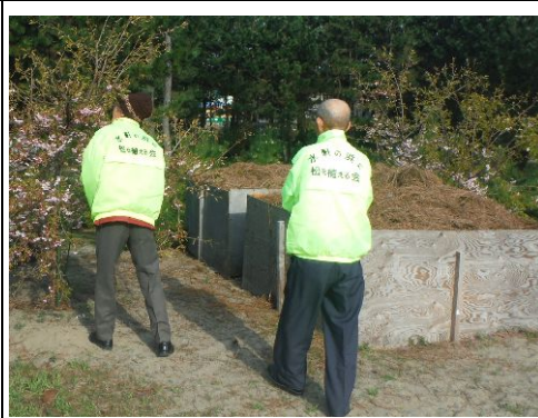
集めた松葉を堆肥にする置場