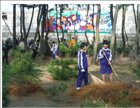
松葉かきをする中学生