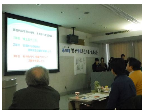
根上中学生徒会の発表