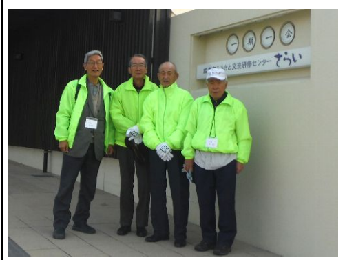
研修センターさらい