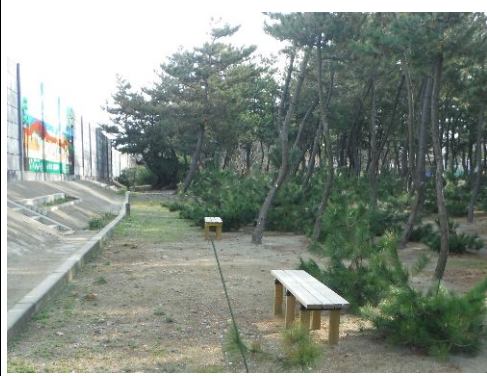
松林と置かれたベンチ