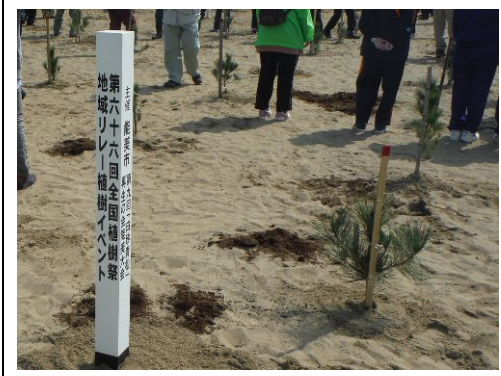
全国植樹祭地域リレー植樹イベント

昼食には松露がいっぱい入ったお吸い物が出た。13時に帰途に着く。帰りは敦賀から 161 号線で。途中、渋滞もあり。和歌山には 19 時頃に到着。次回は出雲大社。