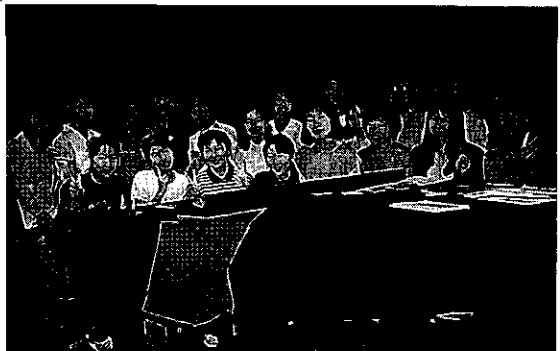
新見女声合唱団 パレット