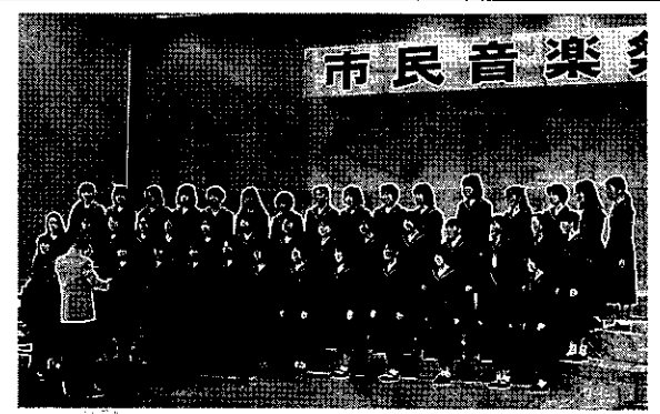
玉島高等学校 合唱同好会

と歌っています。しかし、学期途中で結成されたため他の部と兼ねている人が多く、なかなか全員が揃わない、充分な練習場所が確保できないなど様々な問題があります。けれども、歌うことが好きという気持ちは皆いっしょ。春には新入生が入会し、総勢約六十人という大所帯になりました。全員女子ということ、大変にぎやかです。時に