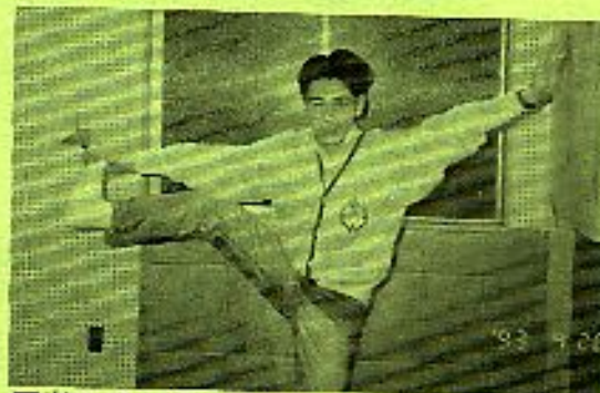
写真のポーズは得意のヨガのポーズ