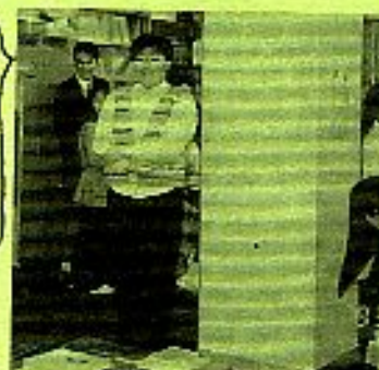
岡大グリーの2本柱