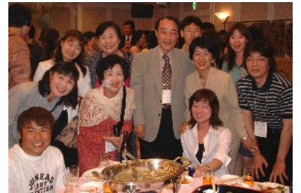
岡山県からの参加者です!