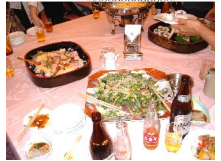
交流会のごちそう。すぐなくなった。