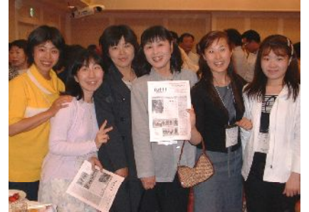
高知のみなさんと